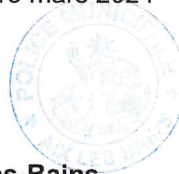
Le Maire d'Aix-les-Bains Renaud BERETTI